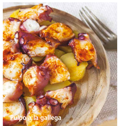
Pulpo a la gallega