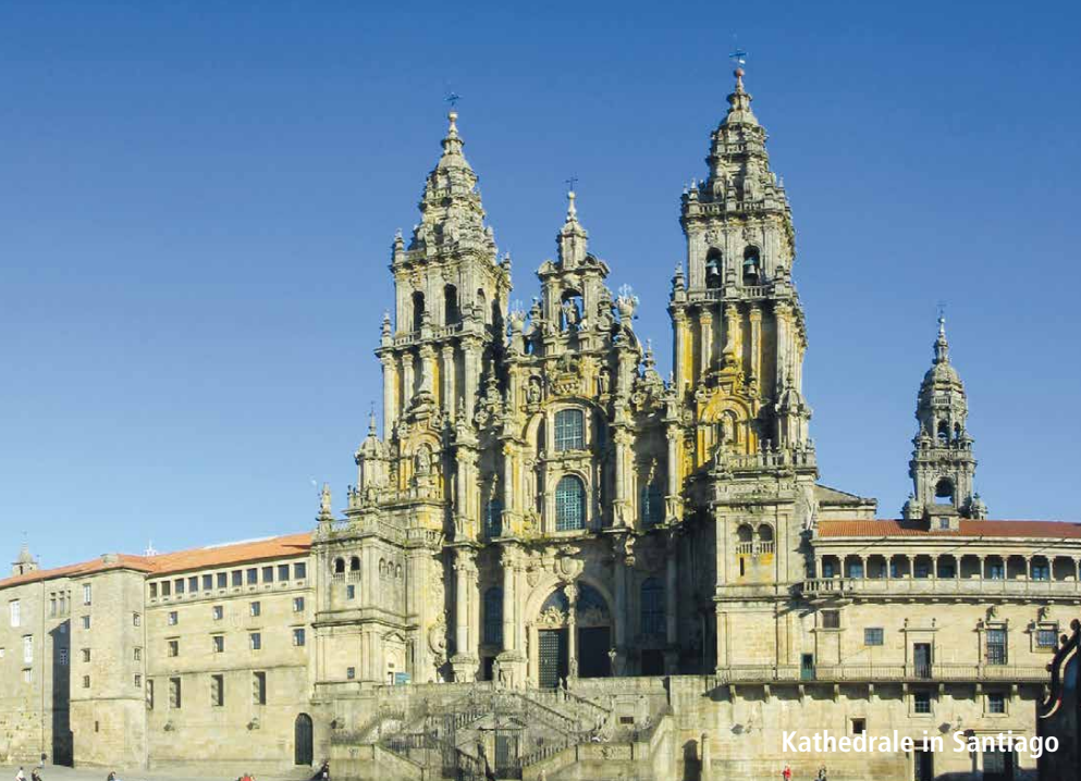
Kathedrale in Santiago